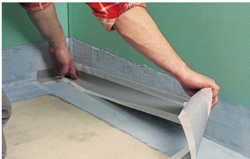
Рисунок 2 – Устройство гидроизоляции стыков