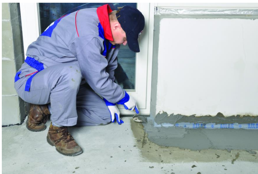
Рисунок 3 – Устройство гидроизоляции стыков

При гидроизоляции полов гидроизоляционный слой должен заходить на вертикальную поверхность на высоту не менее 300 мм.