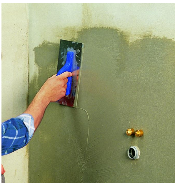
Рисунок 1 – Нанесение гидроизоляционного состава

Не допускается затирать наждачной бумагой поверхность нанесенного слоя перед нанесением последующего слоя .